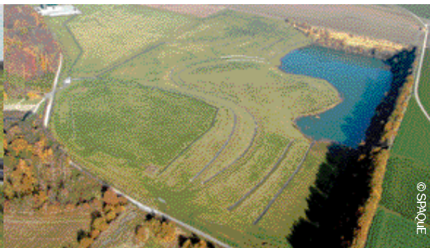
La décharge de Mellery, aujourd'hui: le désastre environnemental a laissé place à un cadre plutôt bucolique.