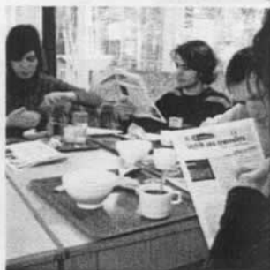
8.15, tout chaud(s), tout frais